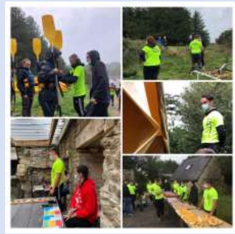
Des jeunes organisateurs vérifient les gilets rappellent les consignes, assurent le secrétariat et le ravitaillement.

Alors en attendant que nos As se retrouvent sur le terrain, continuons à proposer, participer, innover...proposez vos défis.