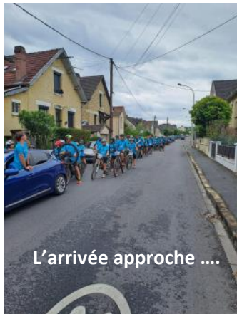
L'arrivée approche ....