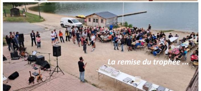
La remise du trophée ...