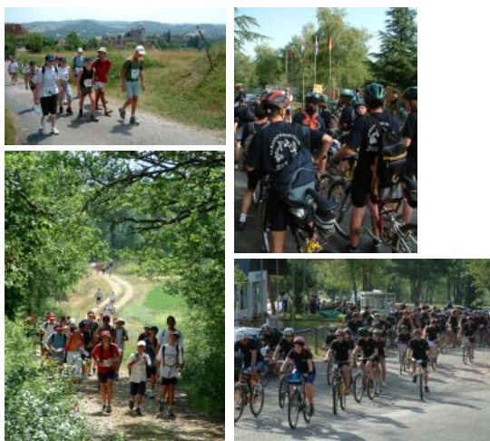
La Rando des Bahuts en Juin 2003 et 2024