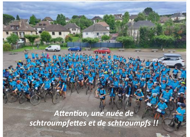
Attention, une nuée de schtroumpfettes et de schtroumpfs !!