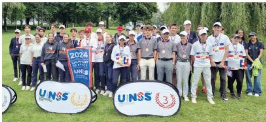
Les meilleures équipes de lycéens golfeurs ont été récompensées

Le championnat de France de golf des lycées (UNSS) s'est tenu au golf du Coiroux à Aubazine du 27 au 30 mai : une réussite sportive, festive et territoriale.