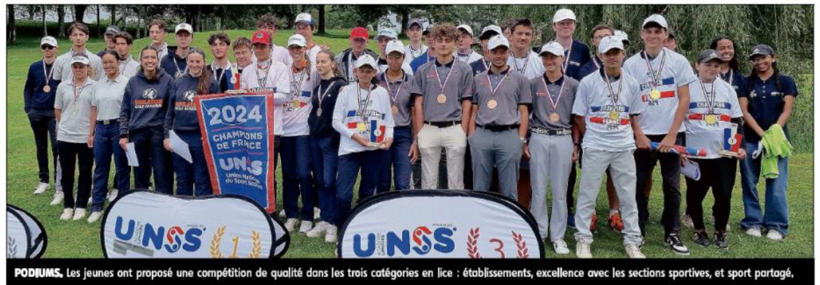
PODIUMS. Les jeunes ont proposé une compétition de qualité dans les trois catégories en lice : établissements, excellence avec les sections sportives, et sport partagé.

La volonté de l'UNSS a été de mettre en avant cette discipline, mais également l'ensemble des jeunes officiels (arbitres,